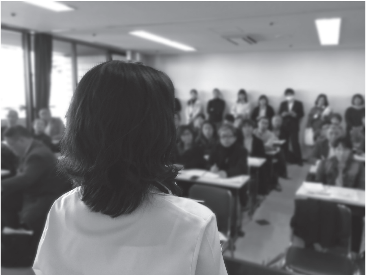
2015年11月12日、第1回期日後に開催された支援者集会で訴える原告